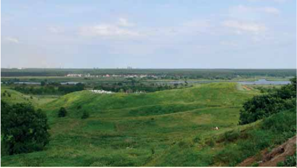
Холм, на котором стоял южный острог города Романова

ки церковь во имя Архангела Михаила, а другая церковь Николы Чюдотворца». Земли во владении Романова было 100 четв. пашни и 200 четв. дикого поля, сена по обе стороны р. Воронеж 1 700 копен, «... лес к Романову Городищу писан в межах по урочищам. А угодыя к Романову Городищу за рекою за Воронежем по Нагайской стороне озерко Кривецкое да озерко Плоское да озерко Городецкое. А те озера все глухие. А рыбных ловель в них нет...».