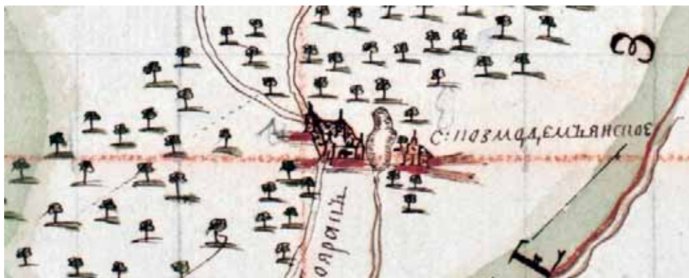
Мокрый Боярак на карте 1720-х гг.

Царь государь, смилуйся, пожалуй – уйми непослушников. Воронежская епархия скудная и г. Воронеж скуден...».