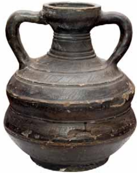
Керамический сосуд конца XVIII в. производства романовских гончаров

В начале XVIII в. Романов теряет своё военное, а с ростом мануфактур на р. Липовка, промышленное и административное значение. Романовская Красногорская пустынь была упразднена в 1721 г., а монахи её переведены в Паройскую пустынь. В 1840 г. на древнем городище находилась деревянная часовня, «стоявшая на месте престола соборной Спасо-Преображенской Красногорской мужской пустыни церкви».