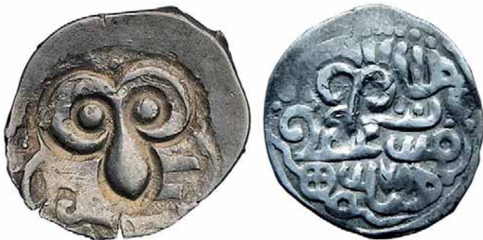
Татарская монета с тамгой рязанского князя («кунья мордка»)

Уже в конце XIV в. южные окраины Рязанского княжества выглядели пустынными. Так, в 1389 г. митрополит Пимен и сопрово-