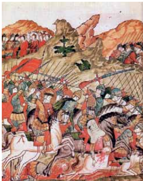
«...И гнаша их до реки до Мечи, и ту множество их избиша, а инии в реце истопоша...» Лицевой летописный свод