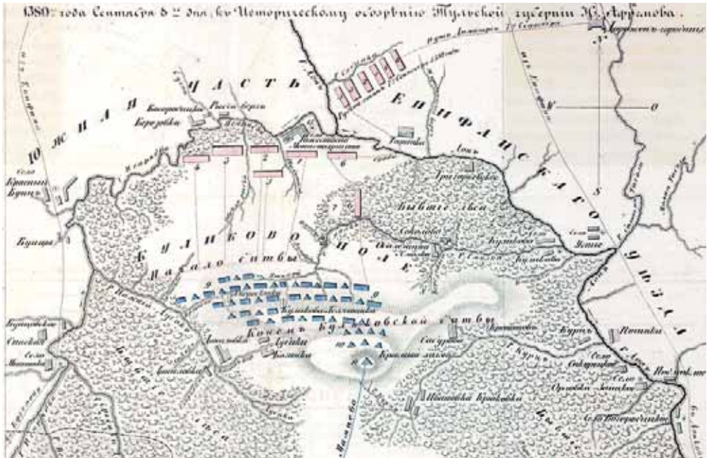
План Куликовской битвы

Битва состоялась 8 сентября (21 сентября по новому стилю). Только рассеялся туман, страшно было видеть, как две великие силы сходились на кровопролитие. Сражение началось поединком двух богатырей: послушника Сергия Радонежского инок Пересвета и татарского богатыря Темир-Мурзы. «И ударились они крепко, так громко и так сильно, что земля содрогнулась, а оба они замертво упали...».