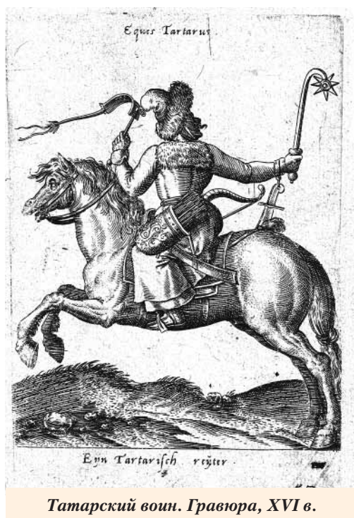
Татарский воин. Гравюра, XVI в.

Порой грабители и захватчики получали достойный отпор. Так, в 1400 г. «Олег, князь Рязанский с князьями Пронским, Муромским и Козельским ходил войною на татар, нашёл и разбил их на р. Хопре, недалеко от берегов Дона». В сентябре 1405 г. «Приходиша Татарове изгоном на Рязань, и посла за ними в погоню князь великий Фёдор Олегович