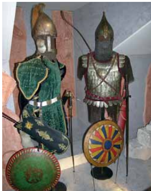
Реконструкция вооружения татарских и русских воинов.

С. Герберштейн, проезжая эти места, писал: татары потерпели «... такое сильное поражение, что земля была завалена трупами более чем на тринадцать тысяч шагов». И по сей день в селениях на р. Красивая Меча бытует множество легенд, связанных с битвой на Куликовом Поле.