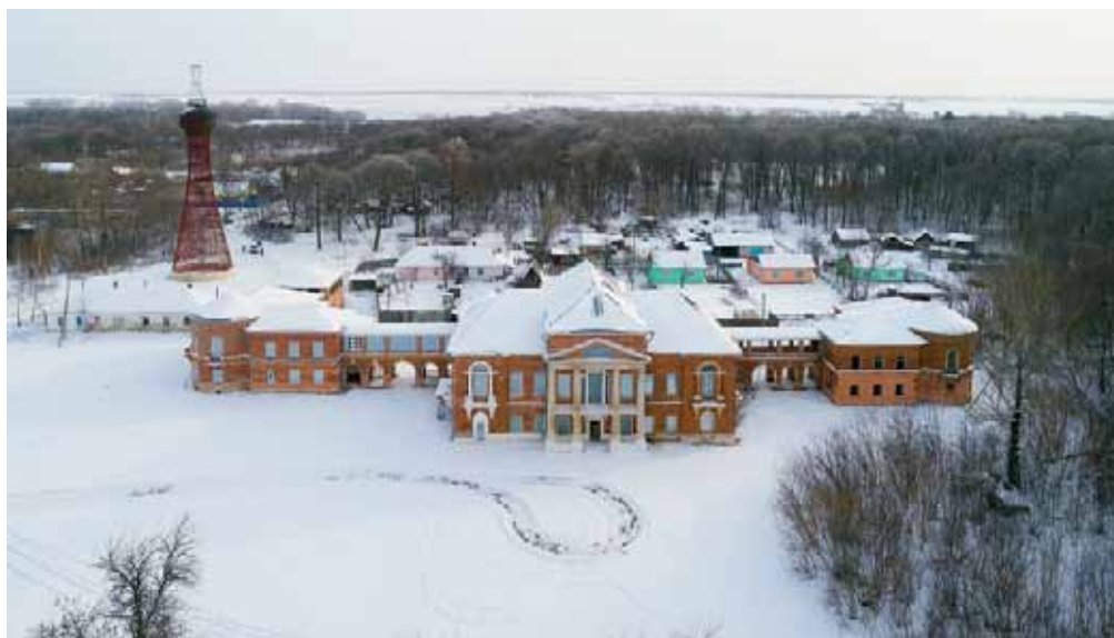
Дворец Нечаевых в с. Полибино

выпаханный на Куликовом Поле в 1824 г., хранился в храме с. Монастырщино.