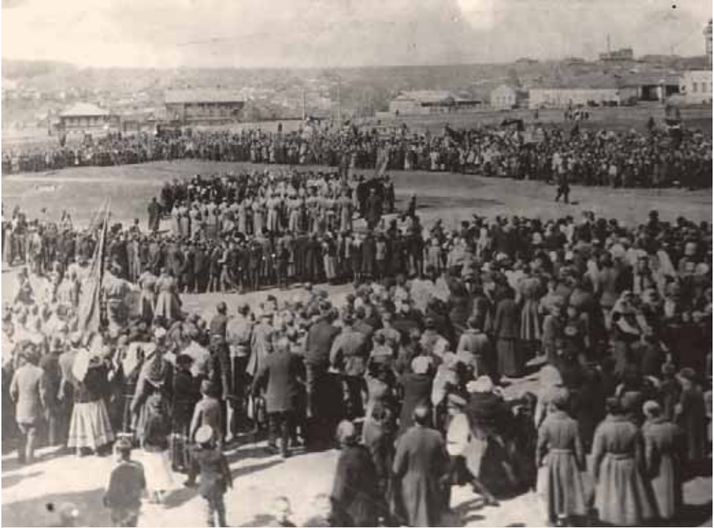
Митинг на Соборной площади в Липецке, 1918 г.