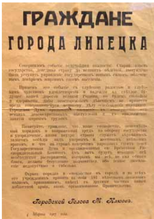
Обращение городского головы Липецка М.А. Клюева к жителям города, 4 марта 1917 г.

В Липецке весть о падении самодержавия получена 1 марта. Вечером 3 марта в помещении Городской думы в обстановке секретности прошло совещание, на котором был создан городской общественный комитет, а 4 марта при активном участии земства — уездный Исполнительный комитет. На Сокольском заводе рабочие, узнав о свержении царя, избрали первый рабочий комитет и создали «боевую дружину». 3 марта на офицерском собрании 191-го пехотного полка капитан Васильев предложил отправить приветствие Временному правительству, обезоружить полицию, освободить политзаключённых и организовать демонстрацию с красным флагом. Полковник Жук, полковник Емельянов и другие офицеры отказались это сделать, после чего командир полка Жук был смещён с командования. М. Хованцева вспоминала,