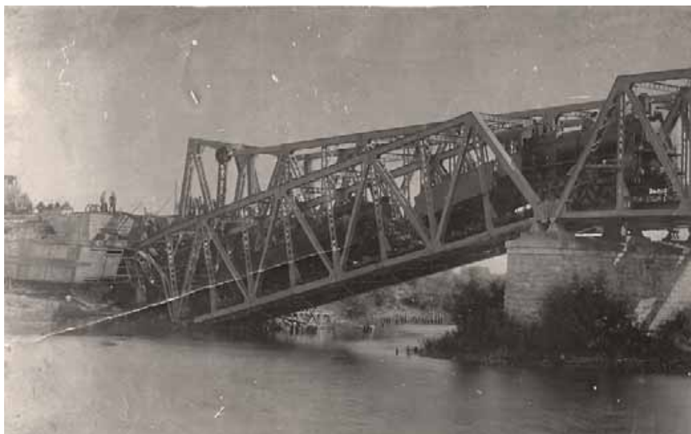
Взорванный мост. Фото 1919 г.

ление и добровольная милиция. На следующий день двухтысячный отряд казаков вошёл в г. Усмань, отдельные казачьи разъезды появились в с. Добринка. К 9 сентября силы Мамантова начали стягиваться к Усмани. Лишь 11 сентября в город вступили части РККА, вскоре арестовавшие членов временного самоуправления, в городе образовалось безвластие, так как все советские работники ранее разбежались. 19 сентября корпус К.К. Мамантова, реализовав поставленные задачи, двинулся на юг.