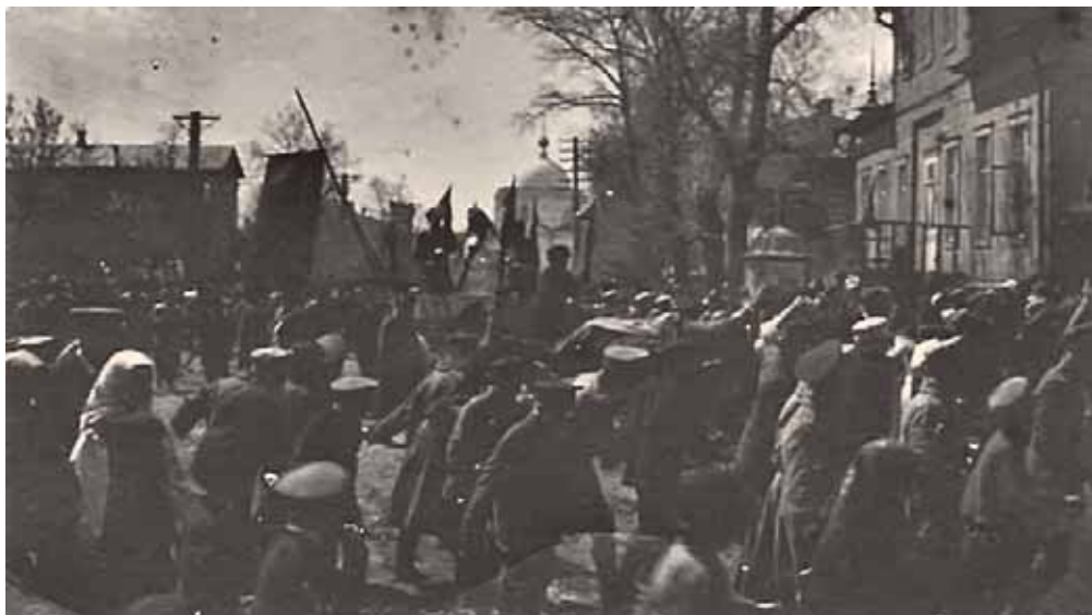
Демонстрация на Дворянской улице в Липецке, 1917 г.

реходе всей власти в Липецке исполнительному комитету во главе с военно-революционным комитетом, «на котором будет лежать обязанность исполнять все декреты и приказания властей», но в конечном итоге от создания его отказались.