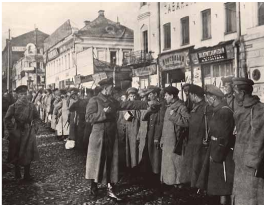
Бойцы продотряда перед отправкой в деревню. Фото 1918 г.

мая 1919 г., в конце августа 1919 г. — в Задонске. В Лебедяни комсомольская организация появилась 9 марта 1919 г. на основе существовавшего Союза революционной молодёжи, а 30 мая 1920 г. прошла первая уездная конференция. В сёлах создавались партийные ячейки большевиков, в которые вступали, в основном, члены комбедов и желающие повысить свой статус в селе. Созданные организации помогали осуществлять диктатуру большевиков, в том числе и продовольственную. В условиях гражданской войны членам партии и комсомольцам пришлось отправиться на фронт, где многие сложили головы.