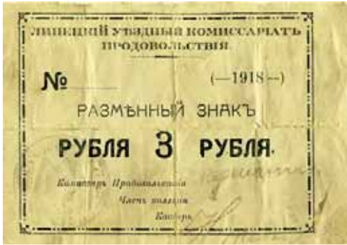
«Липецкие деньги», 1918 г.

продовольствие распределялись по карточкам, но те, кто не состоял на службе у новой власти, карточек не получали!