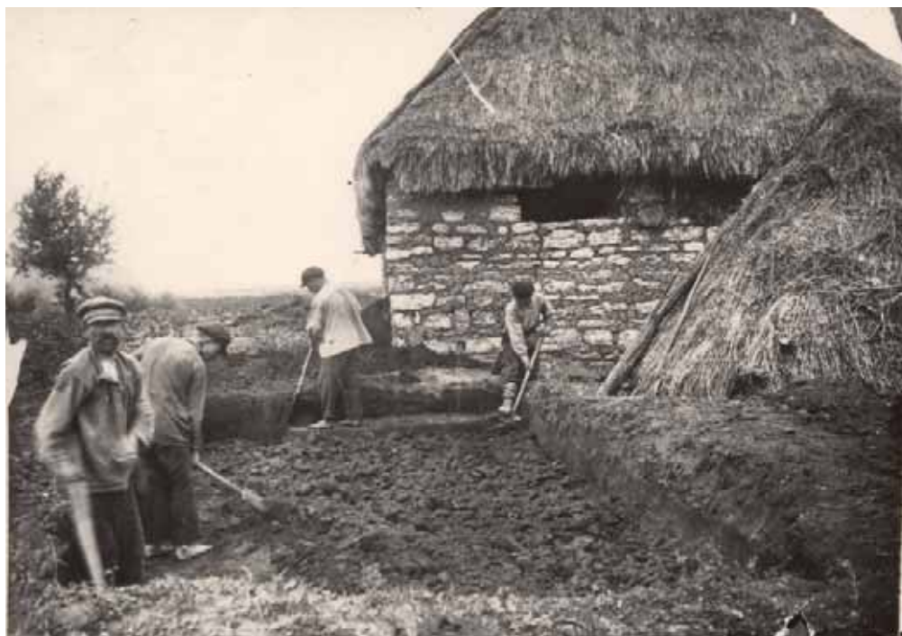
Раскопки в д. Гагарино. Фото 1927 г.

бернский музей о том, что в Гагарино «обнаружены черепные кости мамонта и около них костяное шило около 12 см длины. Ввиду того, что последний предмет указывает на присутствие человека в нашем крае в ледниковый период, необходимо произвести тщательное обследование места находки и ... приступить к раскопкам... Во избежание попыток к самовольным раскопкам ... прошу губмузей сделать соответствующее распоряжение».