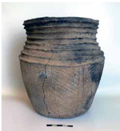
Сосуд катакомбной культуры

Над погребениями знатных представителей рода сооружались курганы, а само погребение сопровождалось богатым погребальным инвентарем, что говорит об имущественной дифференциации. В занятиях катакомбных племён преобладало скотоводство. Бронзу племена катакомбной культуры получали из кавказских центров металлургии.