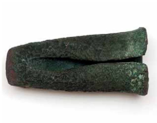
Бронзовый топор-кельт. Найден на р. Битюг

Во время раскопок на территории Липецкой области находки изделий из бронзы достаточно редки. Это бронзовые топоры, ножи, шилья, реже — втульчатые наконечники копий и дротиков, бронзовые украшения. Бронзы поступало мало, а поломанные предметы сразу же отправ-