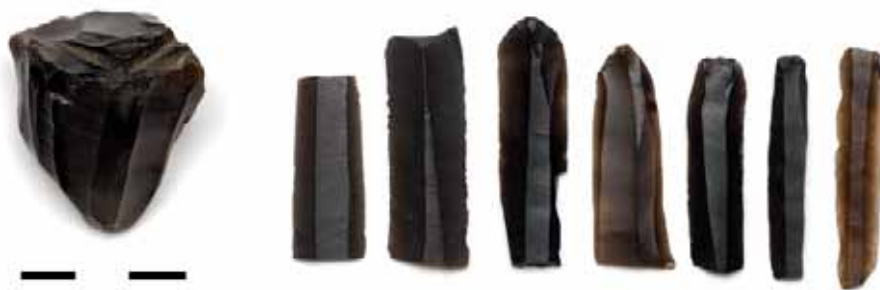
Нуклеус и ножевидные пластины

изготовление орудий труда из мелких ножевидных пластин. Длина пластин, которые скалывались с заготовки — нуклеуса — колебалась от 1 до 5 см, ширина — 0,3–1 см, толщина — 0,1–0,3 см.