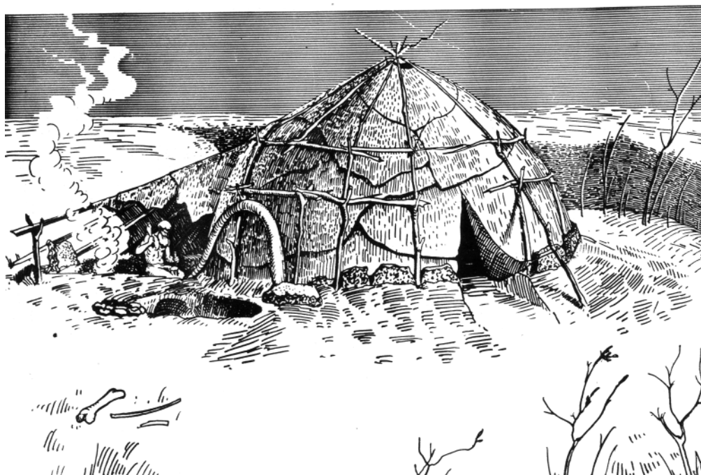
Реконструкция гагаринского жилища. Автор Л.М. Тарасов, 1962 г.

рия верхнепалеолитических статуэток, изображающих женское божество. До этого были известны только единичные находки, поэтому результаты раскопок в с. Гагарино получили мировую известность. Изображение гагаринских «Венер» как образцов палеолитического искусства помещены на страницах многих изданий по истории, археологии, истории возникновения искусства и религиозных верований. Данные находки говорят о том, что основным занятием жителей нашего края в это время была охота на животных мамонтового фаунистического комплекса: мамонта, шерстистого носорога, северного оленя, тура, песца и лисы.