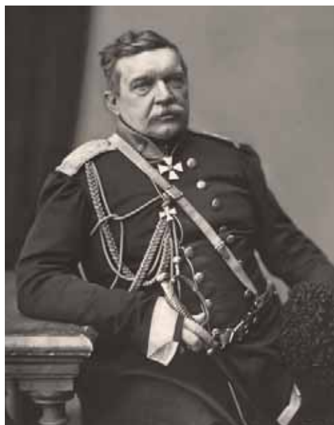
Н.Н. Муравьев-Карский. Фото начала 1860-х гг.