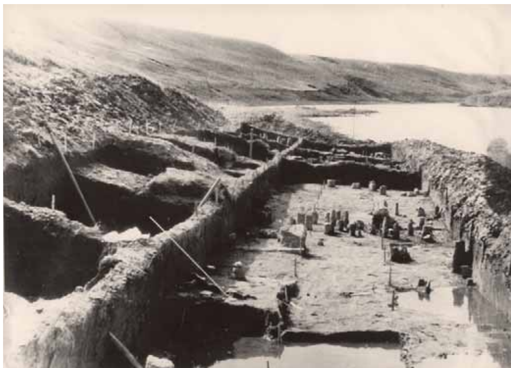
Раскопки Долговской стоянки, 1960 г.

шенной орнаментом из мелких наколов), ямочно-гребенчатой (с орнаментом из ямок и отпечатков гребенки) и поздненеолитической синкретической (с орнаментом смешанного типа) керамикой, названной исследователем «рыбноозёрской». Изучение этих стоянок позволило проследить последовательную смену культур эпохи неолита в зоне лесостепи, где граничат культуры лесного (ямочно-гребенчатого) неолита и степного неолита с накольчатой керамикой.