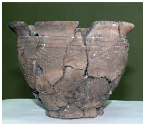
Сосуд абашевской культуры