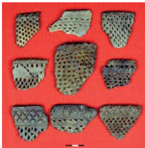
Ямочно-гребенчатая керамика. Стоянка «Липецкое озеро»

Поверхность сосудов покрывалась орнаментом, который служил не только украшением, но имел ритуальное и практическое значение. Керамическая посуда северных, лесных племён рязано-долговской культуры украшалась глубокими ямками и отпечатками, напоминающими оттиски гребенки; подобный орнамент получил название ямочно-гребенчатого. При нанесении орнамента глиняное тесто уплотнялось, а стенки в местах нанесения ямок становились более тонкими и содержимое сосуда быстрее нагревалось. Неровная поверхность сосуда быстрее остывала, чем его содержимое.