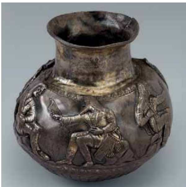
Серебряный сосуд из «Частых курганов». ГЭ

На территории Липецкой области известны сотни памятников раннего железного века: поселений, городищ, курганных могильников. Они оставлены лесными финно-угорскими племенами городецкой культуры, степными скифоидными племенами и родственными им сарматами.