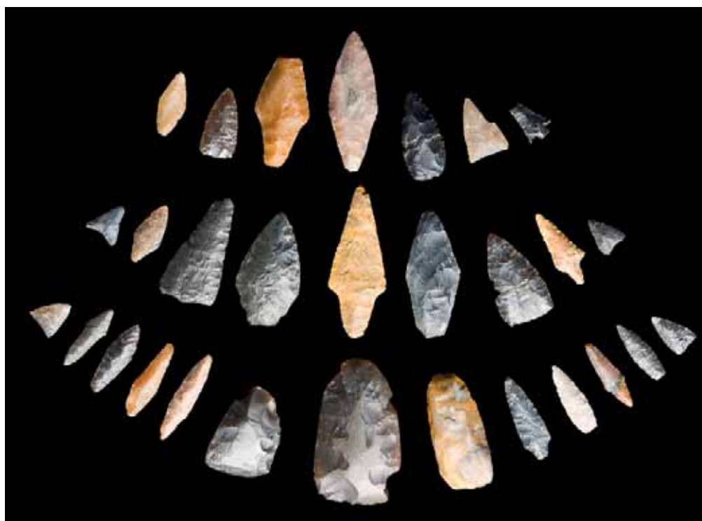
Наконечники копий и стрел, топоры (кремень). Стоянка «Липецкое озеро»

опорных памятников в изучении эпохи неолита бассейна Дона. В процессе раскопок изучен хорошо сохранившийся культурный слой, в котором найдены остатки кострищ, развалы остродонных сосудов с ямочно-гребенчатым орнаментом. Сосуды удалось отреставрировать, и они являются настоящим украшением экспозиции Липецкого областного краеведческого музея.