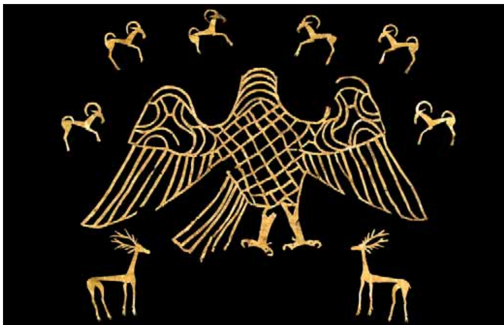
Апликация из золотой фольги из кургана «Ленино-1». ЛОКМ

верных могильников сарматской культуры являются курганы на р. Красивая Меча у с. Вязово Тульской области.