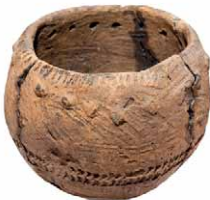
Сосуд ямной культуры