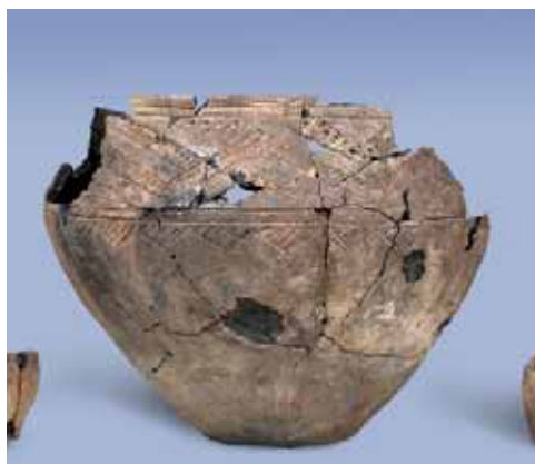
Сосуд срубной культуры

Другая известная на территории Верхнего Дона «абашевская» культура (2 200–1 700 лет до н.э.), получила своё название по месту первых исследований памятников этой культуры у с. Абашево в Верхнем Поволжье. Бронзовые орудия абашевские племена получали с уральских центров металлургии.