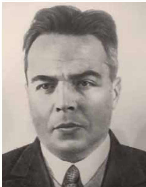
С.Н. Замятнин. Фото 1930-х гг.