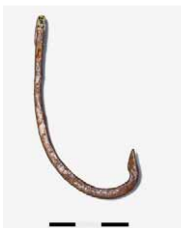
Бронзовый рыболовный крючок. Поселение у старого телецента в Липецке. ЛОКМ