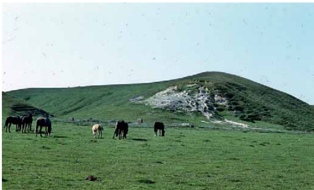
Городище в с. Гудово Добровского района

державший значительное количество примесей: серы, углерода, шлаков, газовых пузырей. После извлечения крицы из плавильной печи (горна) её несколько раз нагревали и проковывали. В результате выгорали примеси, заваривались газовые пузыри, выдавливались на поверхность шлаки. Обработанное таким образом кричное железо можно было использовать дляковки изделий. Данная технология получения железа господствовала на территории Подонья до конца XVII в.