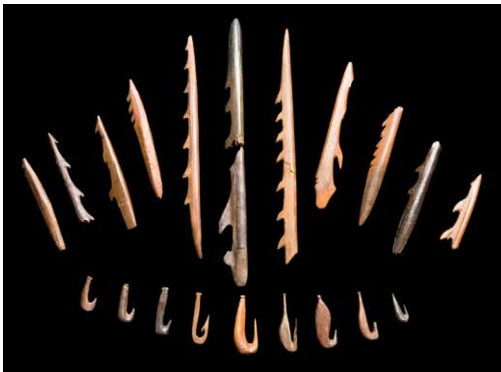
Гарпуны, остроги и рыболовные крючки (кость). Стоянка «Липецкое озеро»

Несколько неолитических стоянок раскопано Верхне-Донской экспедицией в пойме р. Матыра, затопленной Матырским водохранилищем. Это стоянки охотников и рыболовов «Ярлуковская протока-1», «Рыбное озеро-1», «Рыбное озеро-2», по результатам исследования которых получила название «рыбноозёрская культура».