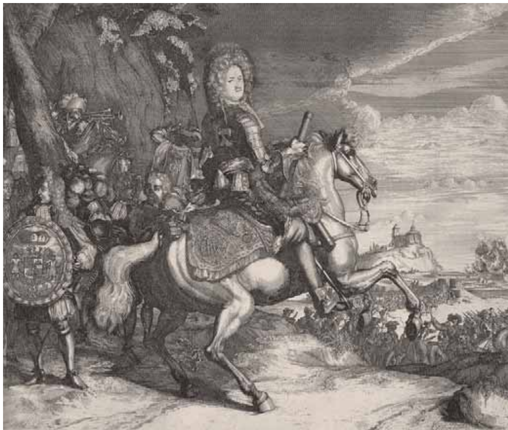
А.Д. Меншиков. Гравюра ок. 1707 г.

дом, и крепостца окружены одним и тем же земляным валом или стеной, которая, впрочем, не занимает большого пространства. Есть здесь и довольно верков, или укрепленных мест, достаточно снабженных пушками; всё это местечко прикрыто с одной стороны горою, а с другой болотом или озером».