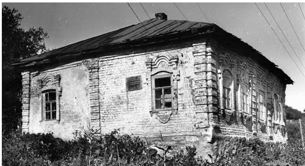
«Дом елецкого воеводы», XVIII в. Фото Г.И. Гунькина, 1960-е гг.

ных, свечных, клееварных заводов. Развивались также шорное и сапожное производства. В окрестностях города действовало множество водоедействующих мельниц и крупорушек. Город славился хлебной торговлей и кожевенным товаром. По данным на 1777 г., в Ельце насчитывалось 149 лавок, проходили крупные ярмарки. Население города в это время составляло около 8 тыс. человек, из которых около 300 принадлежали к дворянскому сословию.