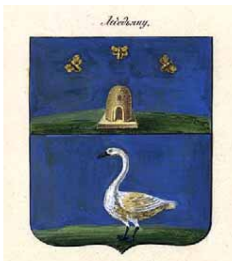
Гербы Задонска, Ельца, Данкова, Раненбурга, Усмани, Липецка и Лебедяни

Цель реформы — наведение порядка в управлении регионами. «Дабы губерния, или наместничество, порядочно могли быть управляемы, полагается в оной от 300 до 400 тыс. душ». В каждом наместничестве должно было быть 12 уездов, каждый с 20—30 тыс. человек. В наместничествах формировались органы дворянского самоуправления — губернские дворянские собрания во главе с губернским предводителем дворянства. Во главе уездов стояли капитан-исправники, избиравшиеся