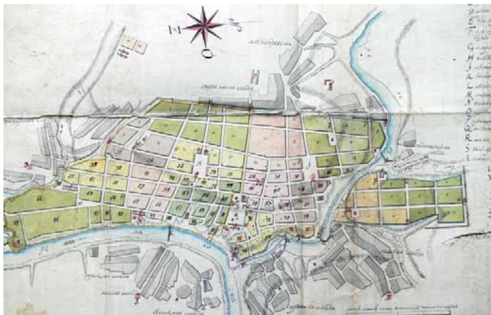
План г. Ельца конца XVIII в.

В 1719–1720 гг. Азовская губерния была разделена на 5 провинций, центром одной из которых стал Елец. Его провинция включала города Талецк, Чернавск, Ливны, Ефремов, Скопин, Раненбург, Лебедянь, Данков, Усмань и Липские заводы с округами.