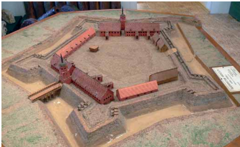
Макет раненбургской крепости.

Описание крепости и её строений оставил находившийся в свите Петра I голландский путешественник Корнелий де Бруин. В своей книге «Путешествие через Московию», изданной в Амстердаме в 1711 г., он писал: «3 февраля прибыли мы в 9 часов утра в имение князя Александра Даниловича Меншикова ... Помещичий дом Меншикова — громадное прекрасное строение, похожее на увеселительный дом, с красивым кабинетом (покоем) наверху, в виде фонаря, покрытого отдельной кровлею, раскрашенною очень красиво всеми возможными цветами. В самом доме множество отличных и удобных комнат, довольно высоко расположенных над землей. Войти в него можно только через ворота крепостцы: и