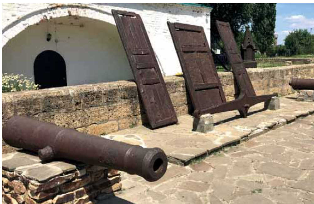
Трофейные ворота и пушки Азовской крепости в Старочеркасске

ла «рублѣв по семи, по осми и больше...». Струги назад не возвращались и часто использовались казаками для военных походов.