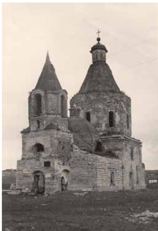
Казанский храм до реставрации. Фото Г.И. Гулькина, 1960-е гг.

В 1639 г. два с половиной десятка ельчан, строивших острожек, просили помощи, после чего было предписано строительство вестями силами служилых людей Бруслановского и Елецкого станов.