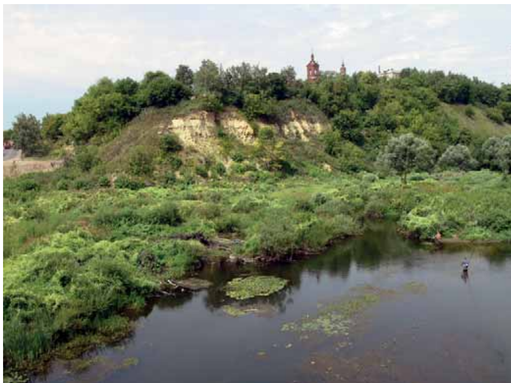
Лебединь. Тяпкина гора