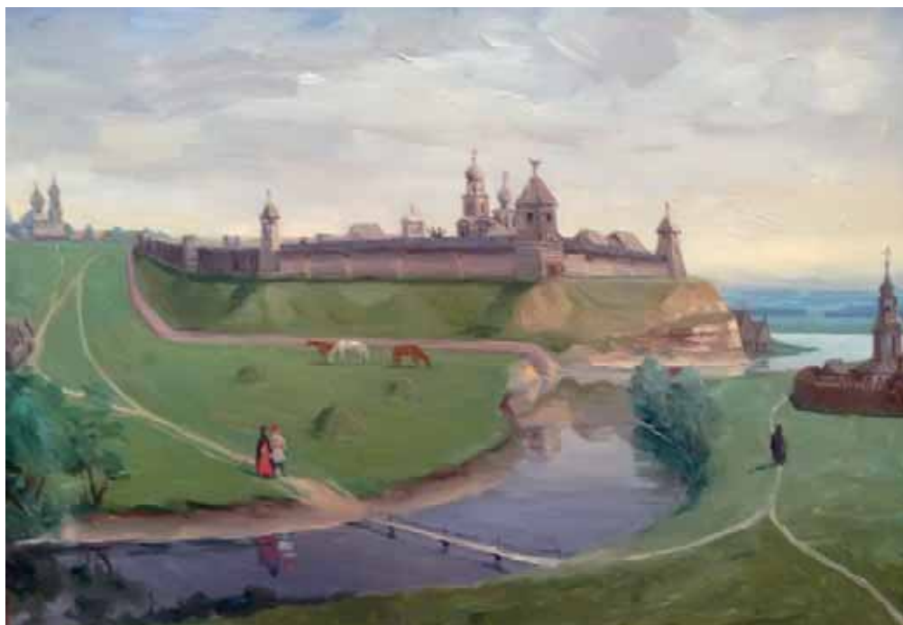
«Данковская крепость». Художник А.Д. Мартынов, 1962 г.

ные пункты в уезде запустели, а в нескольких «крестьяне пашню пашут наездом». В 1632 г. 2 тыс. татар прошли мимо Данкова. В сентябре того же года данковчане, узнав, что небольшой отряд татар перешёл Дон у старого города, пошли за ним следом, настигли и полностью уничтожили.