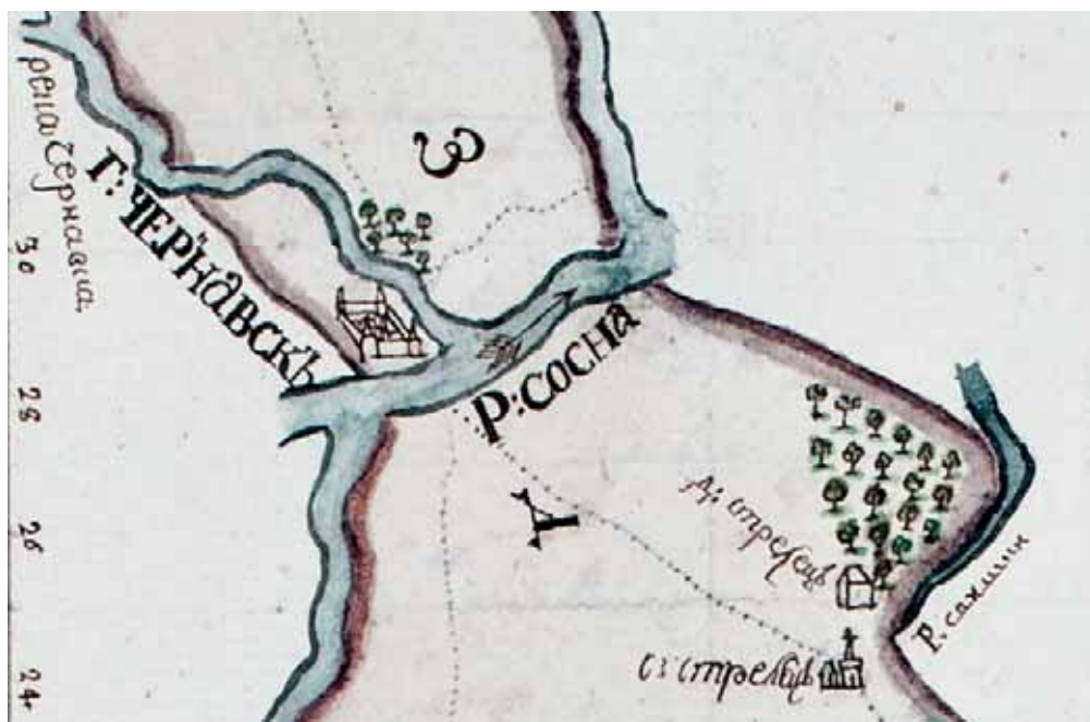
Чернавск на карте 1720-х гг.

город являлся уездным центром Елецкой провинции Воронежской губернии.