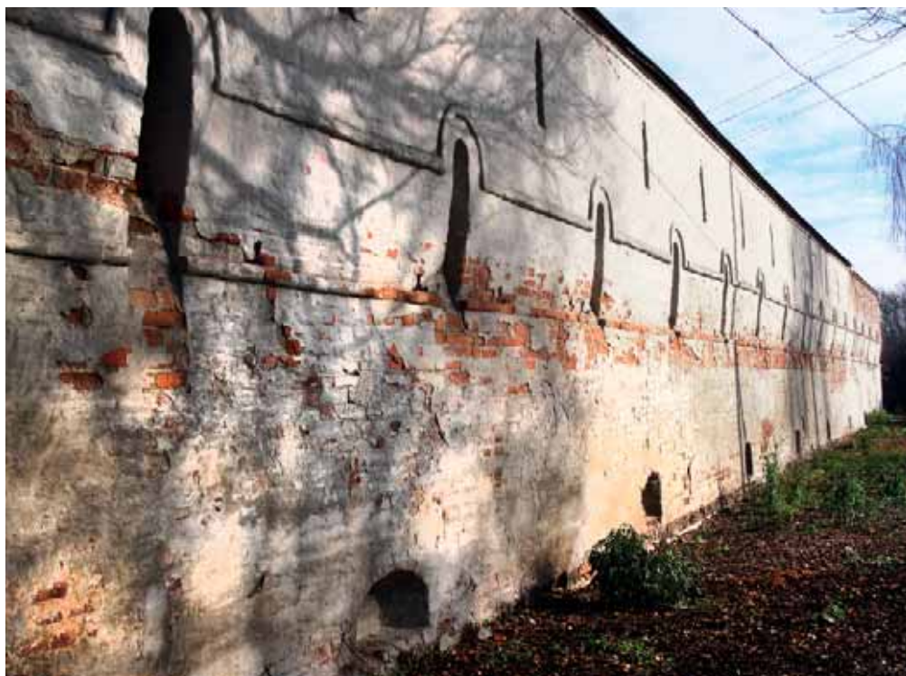
Крепостная стена Лебединского Троицкого монастыря, XVII в.

а на другой стороне к северу леса, к западу леса ж да озеро лебединое большое».