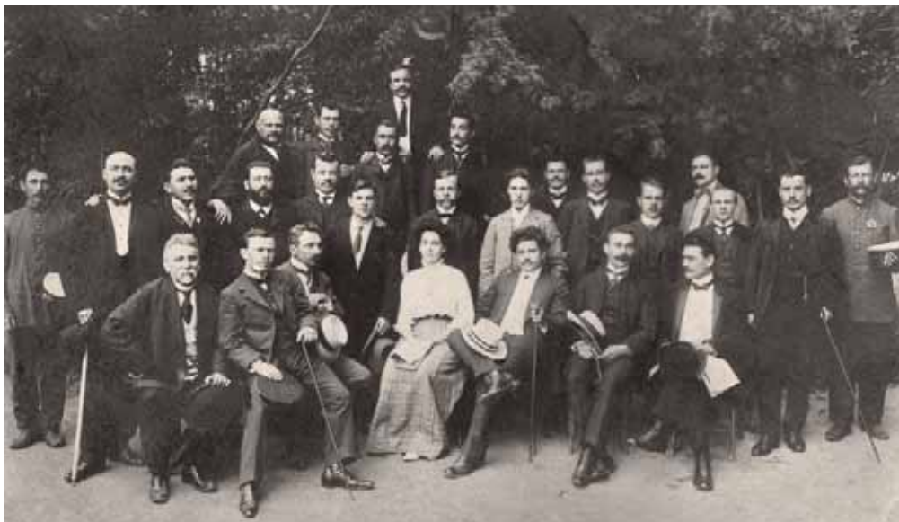
Симфонический оркестр на Липецком курорте. Открытка начала XX в.

щих на курорте; с 1882 г. газета носила название «Липецкий сезонный листок». В Ельце перед революцией выходило несколько газет: «Елецкая жизнь», «Елецкий вестник», «Голос порядка», «Елецкая газета». В Раненбурге местные новости можно было прочитать в «Раненбургском телеграфе», в Задонске – в «Задонском листке».