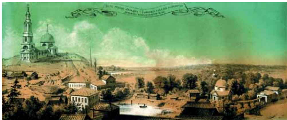
Вид на центральную часть Липецка. Литография 1867 г.

Источники минеральной воды к сезону 1866 г. все благоустроены, и 1 июля в торжественной обстановке им присвоены названия. Источнику № 1 – Петра Великого, источнику № 2 – Альбини, источнику № 3 – Пфеллера. Источники у ванного здания получили название Башмаковских, а вновь открытый в 1865 г. назван Счастливым.