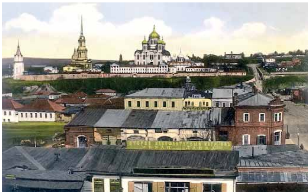
Задонск. Открытка начала XX в.

В 7 км к северу от города, в уединённом месте на берегу р. Проходня, возле ещё одного источника, который освятил своим присутствием святитель Тихон Задонский, на месте бывшей пасеки и кладбища Задонского Богородицкого монастыря в 1873 г. возник мужской Свято-Тихоновский Троицкий монастырь, более известный как скит. В Троицком соборе монастыря хранится частица мощей св. Тихона Задонского. Монастырь и св. источник при нём не менее почитаемы паломниками, чем Задонский Богородицкий монастырь, и здесь у источника всегда особенно многолюдно.