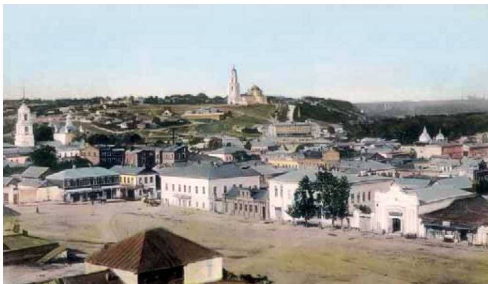
Вид Липецка. Открытка начала XX в.

горшечных — 10, 1 человек трудился на маслобойне, по 1 на семи просорушках и на 12 ветряных мельницах, кроме того на старых заводских плотинах продолжали работать три водяные мельницы. К началу XX в. количество рабочих в Липецке составляло 360 человек. В 1916 г. в Липецке построены аэропланские мастерские с 18 рабочими местами. К этому же времени в городе начинают работать 3 мыловаренных завода и 3 салотопенных.