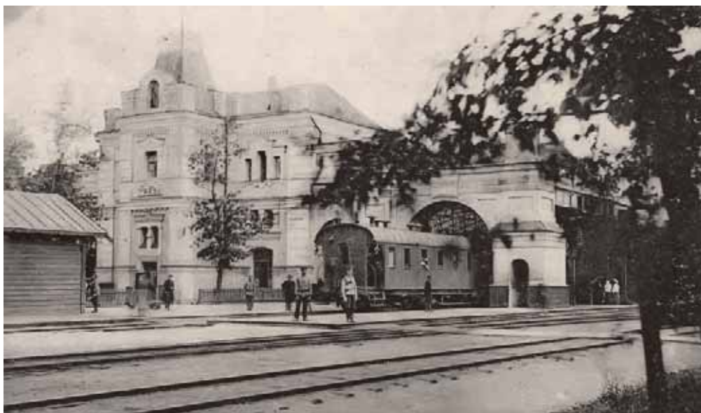
Станция Грязи. Открытка начала XX в.

после 1861 г. «развитие капитализма в России пошло с такой быстротой, что в несколько десятилетий совершились превращения, занявшие в некоторых старых странах Европы целые века». Разорались не перестроившиеся на капиталистическую систему хозяйствования помещики, началась распродажа земли, которую теперь покупали не только дворяне, купцы и промышленники, но и состоятельные крестьяне. Цены на землю выросли за полвека в 10 раз.