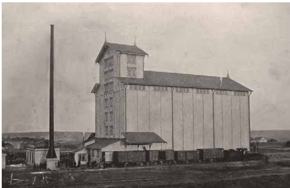
Элеватор. Фото начала XX в.