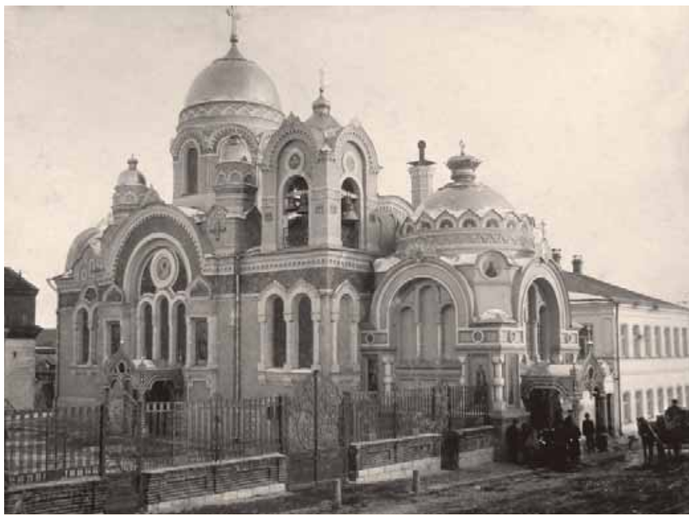
Великокняжеский храм в Ельце. Открытие 1910-х гг.

Задонске — женская, в Усмани — женская. Специальными средними учебными заведениями могли «похвастаться» только Липецк (реальное училище), Усмань (реальное училище) и Елец (техническое железнодорожное училище). В Липецке, Данкове, Раненбурге и Задонске работали духовные училища.