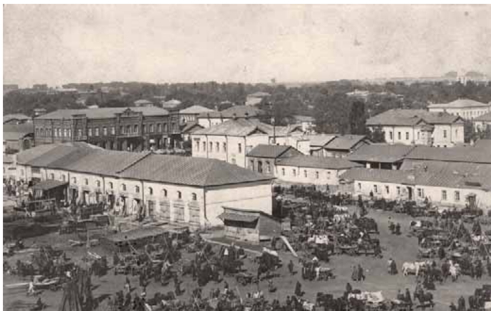
Ярмарка в Усмани. Фото начала XX в.

17 ноября 1867 г. в 5 часов вечера на станцию «Усмась» пришёл первый поезд с 22 вагонами рельс для строительства железной дороги. 20 декабря через Усмась прошёл на Воронеж первый пробный пассажирский поезд, а 19 января 1868 г. открылось уже регулярное движение.