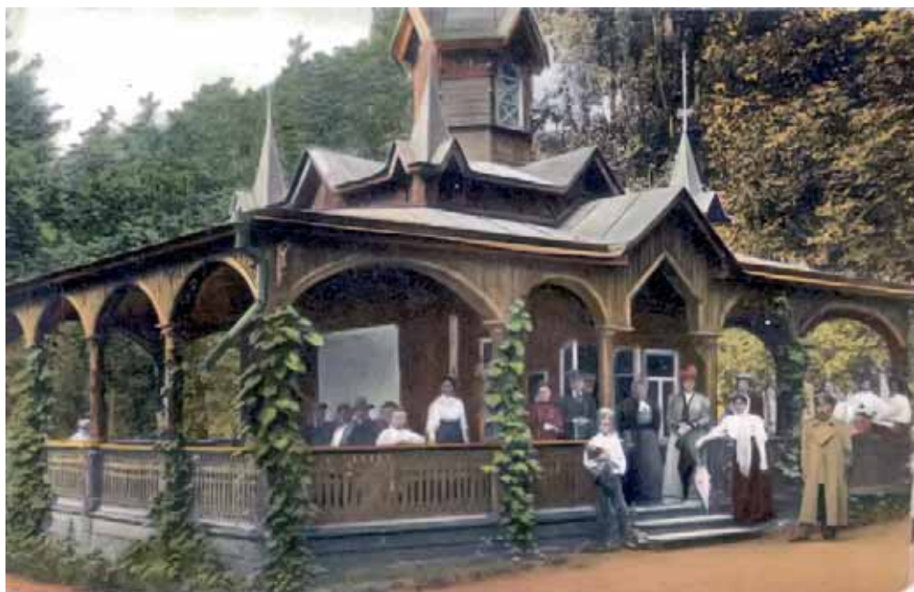
Читальня в Нижнем парке. Открытка начала XX в.

руб. 77,25 коп. Приезд большого количества отдыхающих заставил приступить к строительству новой гостиницы. Постепенно благоустраивался и расширялся Нижний парк.