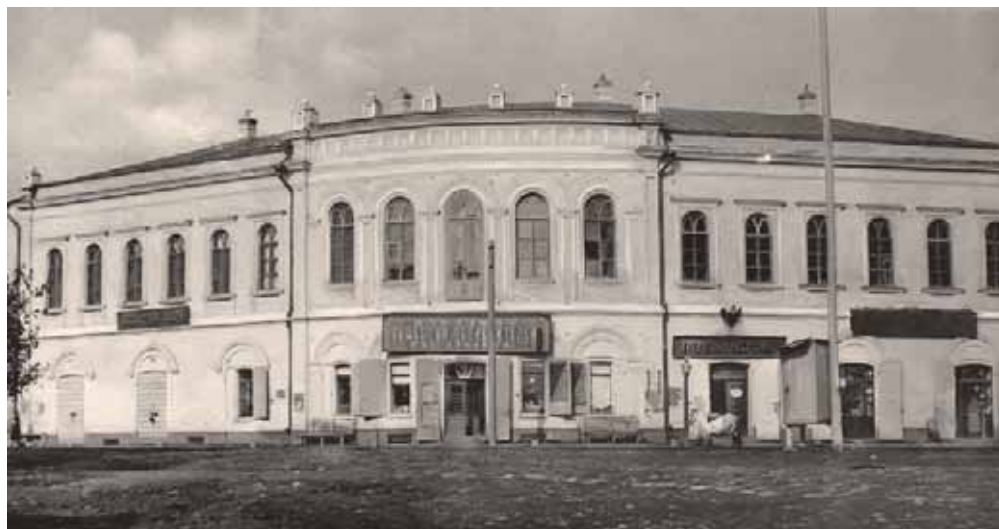
Дом Пешкова. Открытка начала XX в.