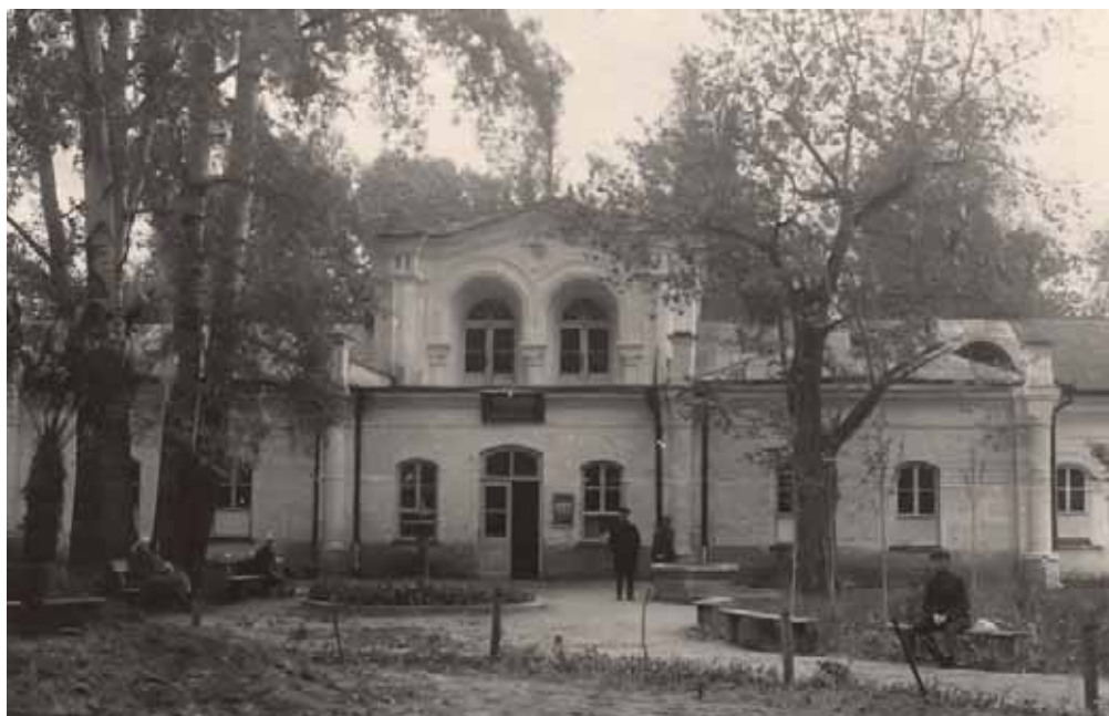
Здание минеральных ванн. Фото 1920-х гг.

Значительным событием в истории развития курорта становится введение грязелечения. Активно грязелечение стало применяться «после того, как химик Матисен в 1871 г. своими химическими анализами доказал аналогичность торфов Липецкого и Францесбадского». Часть кабин ванного здания была переоборудована для грязелечения. Липецкие грязи получили большую известность. Профессор С.П. Боткин считал: «грязь — это будущее Липецка». 28 июля 1903 г. Горный департамент констатировал: «... Липецкий железистый торф известен как один из лучших в Европе, по составу своему близко приближается к Францесбадскому и в большом количестве выписывается даже к Высочайшему двору». Экспорт целебных грязей по сведениям на 1915 г. в среднем составлял 464 пуда!