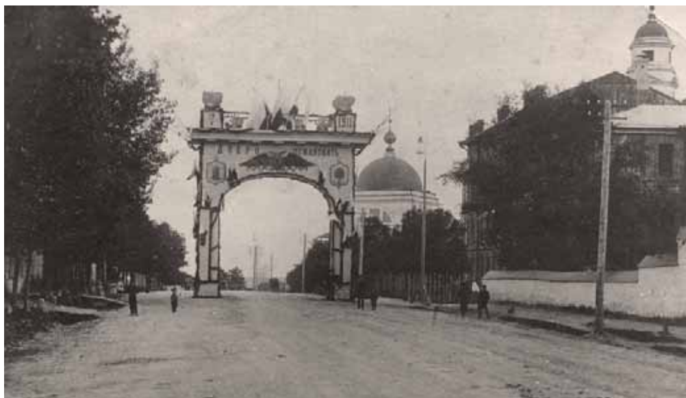
Лебедянская улица в Липецке. Открытка начала XX в.