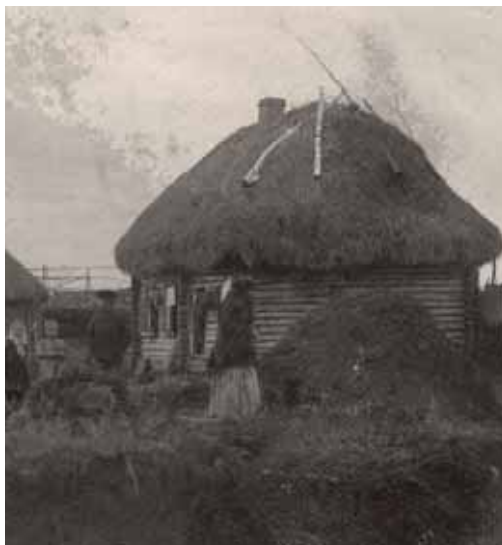
Крестьянский дом в Усманском уезде. Открытка начала XX в.

Так как бань в крестьянских домах не было, то парились в топке русской печи, выстилая её соломой. В левом ближнем углу стояли стол, коник и лавки. Над ними в «красном углу» висели иконы и лампада. Кроватей не