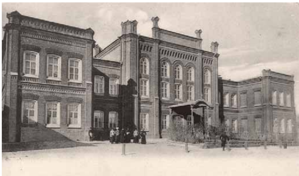
Здание женской гимназии. Фото начала XX в.