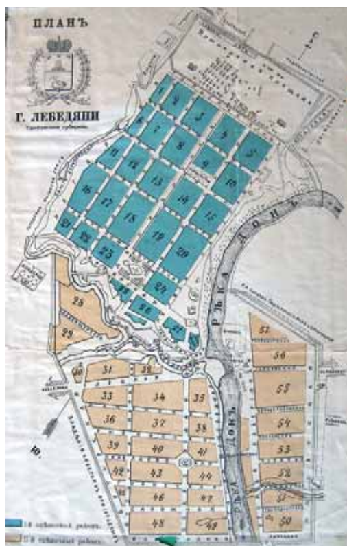
План г. Лебедянь, 1914 г.

женская школа. В 1876 г. начала свою работу мужская четырёх-классная прогимназия.