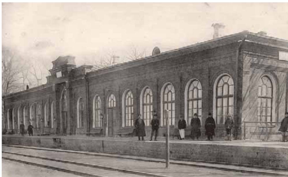
Вокзал в Липецке. Открытка начала XX в.

Троицкой (Ново-Базарной) площади, здесь продавали преимущественно лошадей и крупный рогатый скот. После 1863 г. в Липецке был открыт городской общественный банк. С 1867 г. в городе выходила курортная газета «Липецкий сезонный листок».