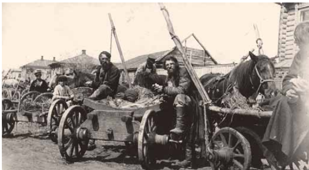
Крестьяне на ярмарке. Фото начала XX в.