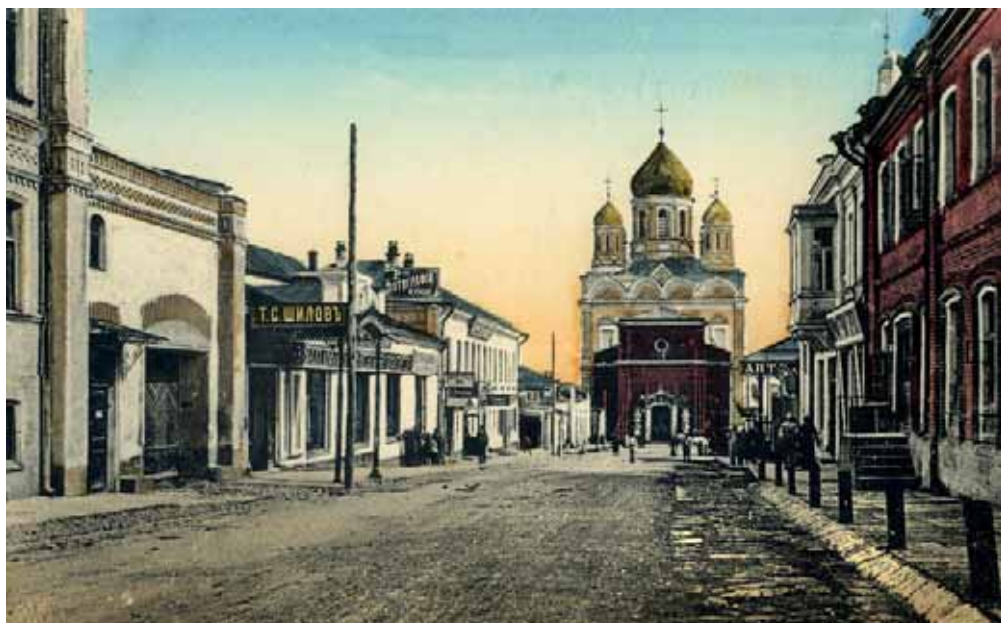
Улица Орловская в Ельце. Открытка начала XX в.

По данным на 1872 г., в Ельце насчитывалось 29 688 жителей. По данным Всероссийской переписи 1897 г., в городе проживало 37 455 жителей. В 1915 г. население Ельца составляло 46 982 человека.