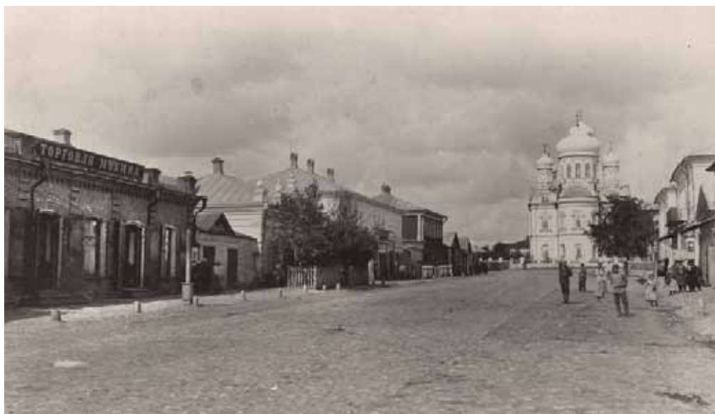
Московская улица в Данкове. Фото начала XX в.

В 1913 г. Данков занимал площадь «91 дес. 2 068 саж. В городе 1 площадь, 16 улиц и 3 переулка. Длина улиц и переулков около версты. В городе имеется общественный сад, освещение керосиновое, водопровода и канализации нет. Водой город пользуется из Дона, Вязовенки и двух колодцев». В Данкове действовали земская больница, почтовая станция, 2 гостиницы, 3 трактира, 5 постоянных дворов и 6 чайных; 28 различных ремесленных заведений, типография мещанина Михаила Алексеевича Иванова на Ремесленной улице.