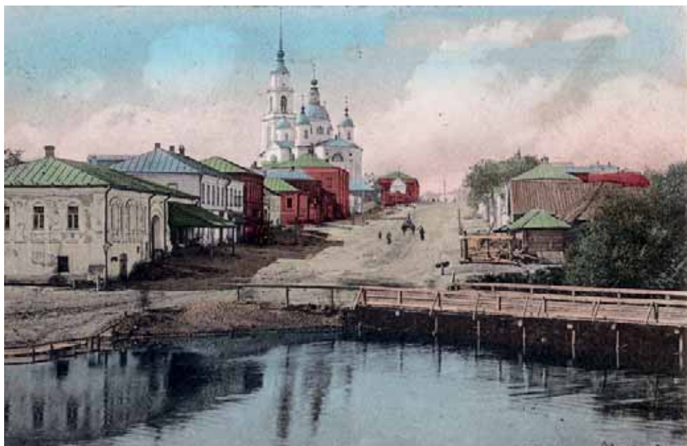
Козловская улица в Раненбурге. Открытка начала XX в.

северной окраине города вместо деревянной в 1831 г., добавились Никольский храм (1855–1860 гг.) в русско-византийском стиле, сооружённый на средства потомственного почётного гражданина Игнатия Леонтьевича Калашникова, а также Никольский храм в Зареченской слободе, построенный в 1874 г. по проекту К.А Тона.