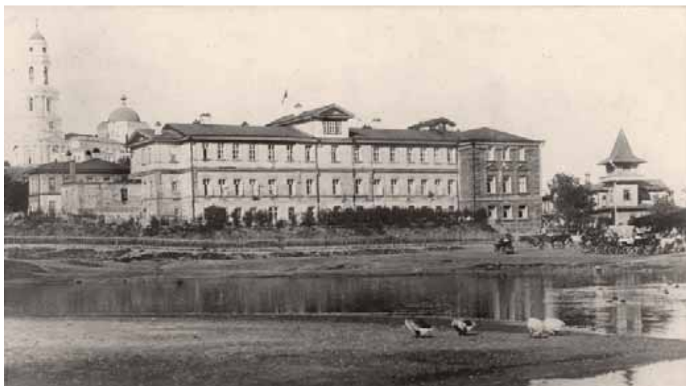
Курортная гостиница. Фото начала XX в.

становила: принять Липецкие минеральные воды от акционерного общества ввиду несостоятельности общества и ликвидации их дел. Правительство командировало в Липецк для геологического обследования профессора Ивана Васильевича Мушкетова (1850–1902), который открыл несколько новых минеральных источников и объяснил, как образуются воды.