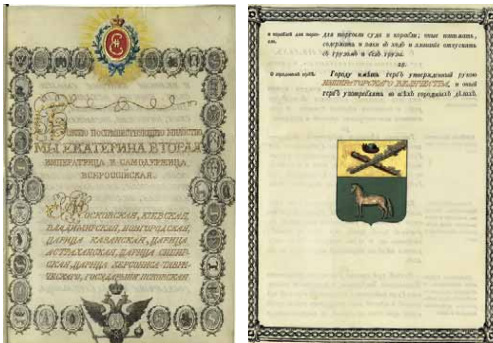
Жалованная грамота Екатерины II Данкову с гербом города, 1780-е гг.

ная об одном этаже, во имя Рождества Пресвятыя Богородицы с пределами святых апостол Петра и Павла и преподобнаго Аврамя Затворника, вторая – приходская об одном этаже во имя Великомученика Димитрия Солунскаго. Школа, утверждённая в 1786 г. для юношества, разделена на два класса... Строений в городе каменнаго – бывшее казначейство, каменные соляной и винной магазины ... В городе гостиного двора не имеется, торговых лавок девятнадцать. Торги имеются ежедневные по пятницам. В них торгуют разным хлебом, бумажными и мелочными товарами, рыбою, мёдом и дёхтем. Бывает в год две ярмонки...».