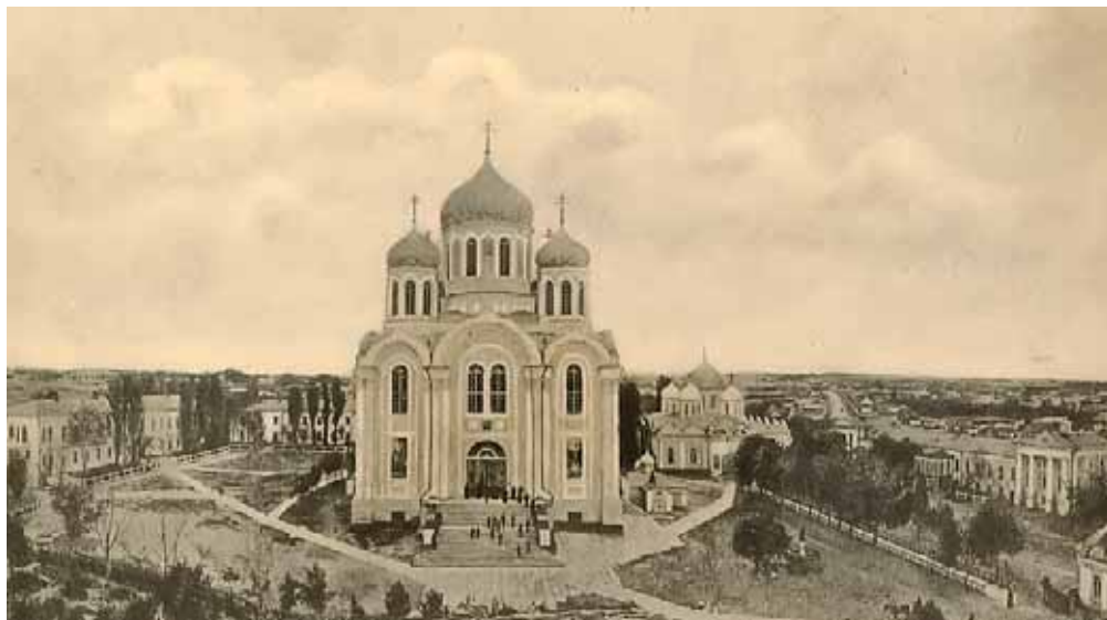
Владимирский собор Богородицкого монастыря. Открытка начала XX в.

В маленький городок к мощам святителя Тихона приезжало немало его почитателей. Многие из них заботились о прославлении великого подвижника и хлопотали о его канонизации. Ещё до официального причисления Святителя к лику святых появились его иконы, таковыми считались его прижизненные портреты, и почти сразу после кончины Пресвященного Тихона Задонского началось издание его многочисленных сочинений.