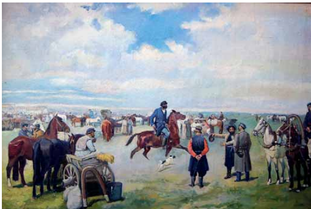
Конная ярмарка в Лебедяни. Худ. П. Соколов

По данным на 1788 г., в Лебедянском уезде было 31 село и 26 деревень. В них насчитывалось 4 155 дворов с населением 13 908 душ м.п. и 11 957 ж.п. В самой Лебедяни был 601 двор, в них проживало 1 520 душ м.п. и 1 109 душ ж.п., всего 2 629 человек.