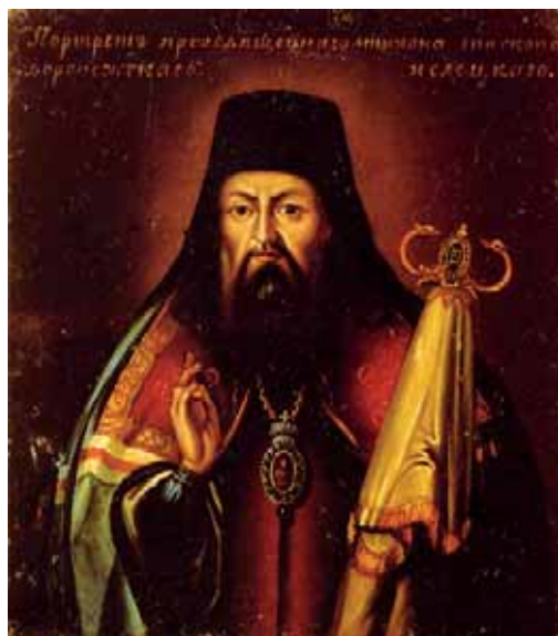
Портрет епископа Воронежского и Елецкого Тихона, конец XVIII в.

В 1835–1836 гг. от Задонска до Хлевногo устроили шоссе, а в 1851 г. открыта шоссейная дорога от Задонска до Воронежа — первая в Воронежской губернии. Через р. Дон в городе на лето устраивалась паромная переправа, а в 1799 г. был впервые установлен плашкоутный мост.