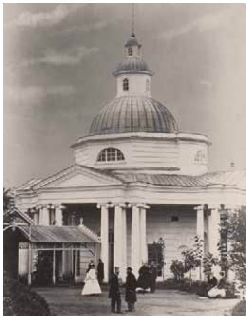
Бювет Липецких минеральных вод. Фото 1880-х гг.

выполнен архитектором курорта А.Ф. Славинским — первым архитектором курорта, а по существу — первым главным архитектором города. Славинский, наделённый правами губернского архитектора, контролировал исполнение плана застройки города, отводил участки под застройку, согласовывал проекты. Проект бювета-павильона, где пили минеральную воду, стал его первым реализованным проектом в Липецке.