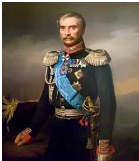
И.В. Васильчиков. Худ. Ф. Крюгер, 1840-е гг.

ковский уезд направил в ополчение 1 189 человек. Собранные в первой половине августа 1812 г. военными приёмщиками в разных сборных местах ополченцы из Данковского уезда направлялись в Михайлов, где должны были расположиться в ожидании сбора всего рязанского ополчения.