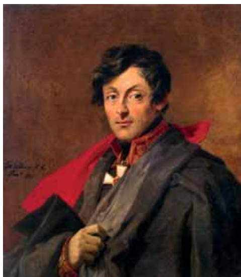
А.И. Остерман-Толстой. Худ. Д. Доу, 1825 г.