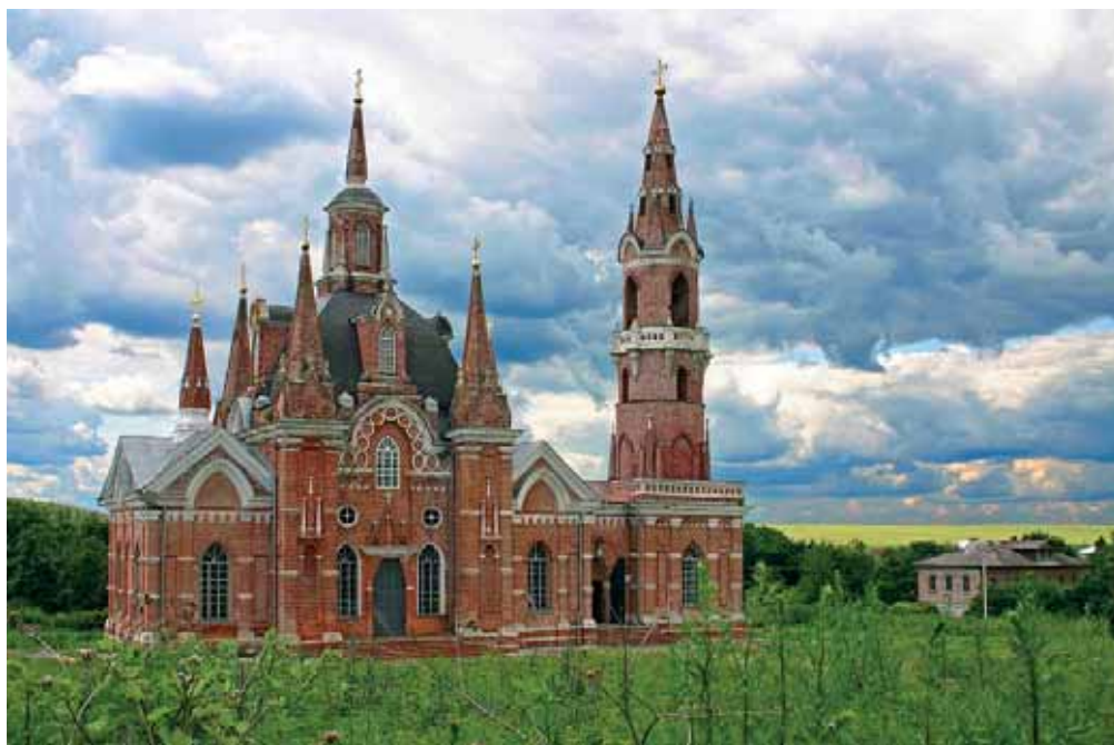
Знаменский храм с. Вешаловка

училища с двумя классами. Например, уже в 1787 г. в Данкове открыто приходское училище, в 1797 г. – малое народное училище. В начале XIX в. во всех уездных городах нашего края действовали уездные и приходские училища, в Липецке и Данкове действовали духовные училища – начальные учебные заведения для подготовки священно- и церковнослужителей.