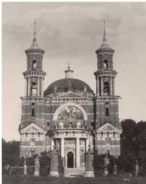
Владимирский храм с. Баловнево. Фото начала XX в.

жен проект Н. А. Львова; прекрасный образец храмового зодчества эпохи классицизма — ансамбль Троицкой церкви и колокольни в с. Новотроицкое Елецкого уезда (1809—1815 гг.); единственный на территории нашего края двухъярусный хорам-ротонда св. Автонома (1823 г.) и храм-колокольня св. Митрофана Воронежского (1832 г.) в с. Кашары Задонского уезда; особенно изысканная в своём стилевом решении Знаменская церковь в с. Кузьминка Лебедянского уезда (1797—1822 гг.), проект которой близок к кругу московского архитектора Р. Казакова; яркий пример русско-византийского стиля в лице Вознесенского собора в г. Ельце (1845—1889 гг.), построенный по проекту К. А. Тона и др.