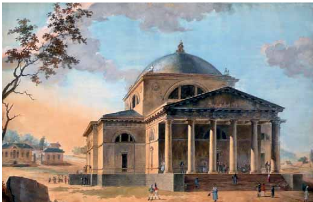
Христорождественский собор. Акварель, 1805 г.