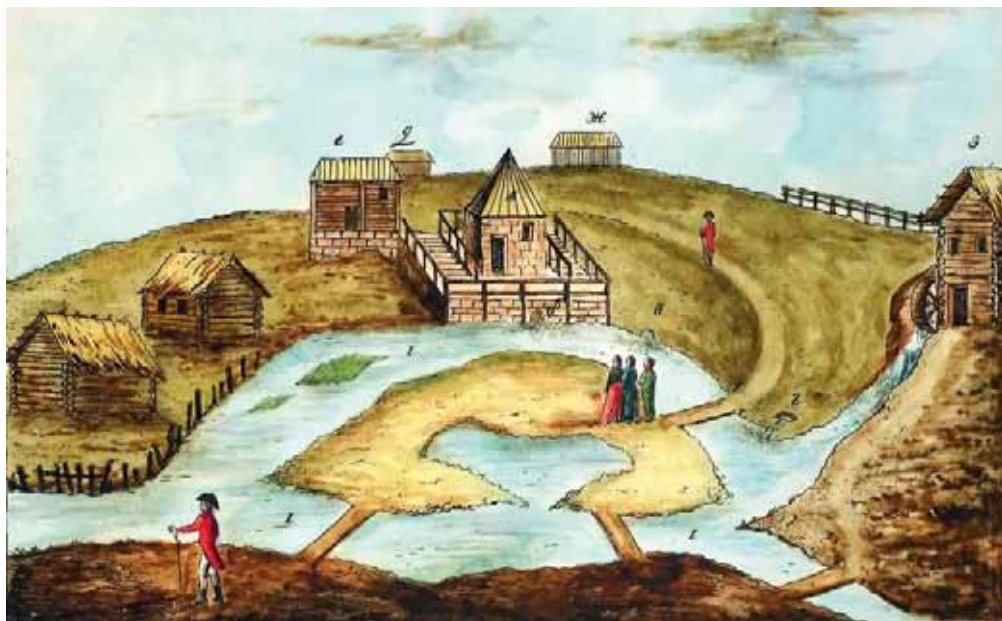
Липецкий курорт. Рис. И. Пфеллера, 1803 г.

Сам Липецк в начале XIX столетия более напоминал большую деревню. И именно благодаря курорту начался процесс превращения маленького уездного городка в благоустроенный курортный город. Бла-