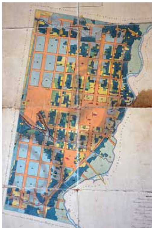
План г. Усмань, 1847 г.

В 1828 г. открыта городская больница на 15 кроватей. В городе работала почтовая контора, действовал этапный дом и тюрьма.