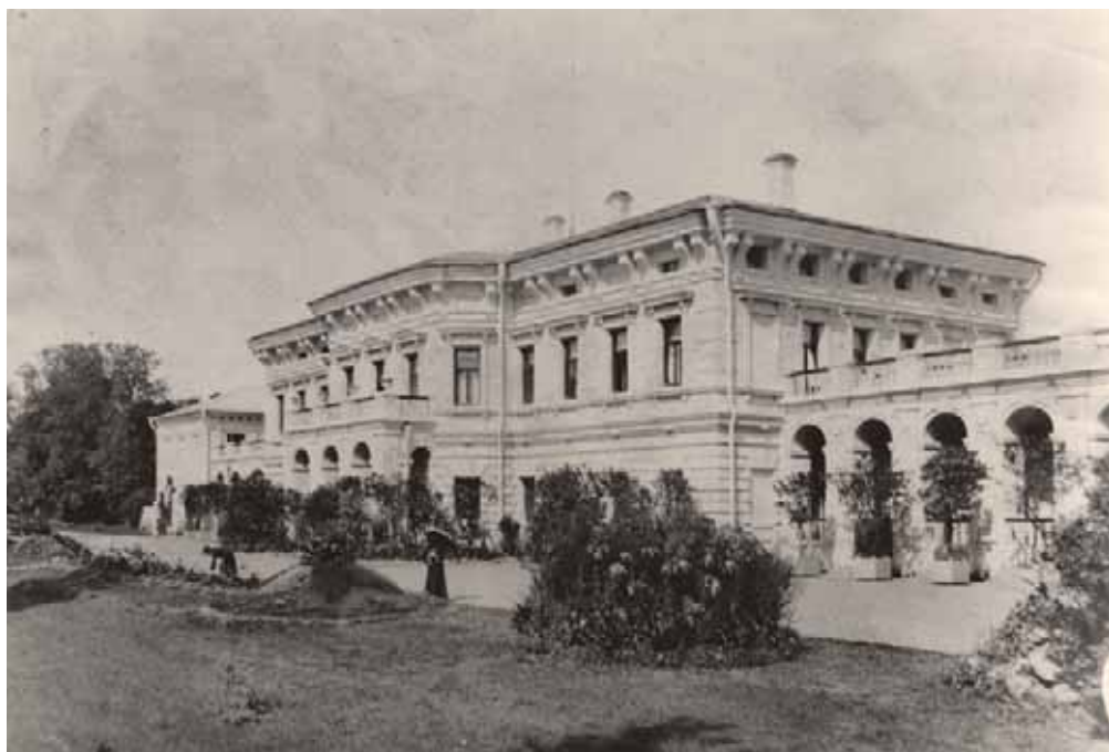
Усадебный дом в с. Баловнево. Фото начала XX в.

Живопись была представлена также портретами и художественными полотнами в усадебных собраниях. Например, у Муромцевых в Баловнево хранился «портрет императрицы Екатерины II, писан Боровиковским». Там же, кстати, значились ещё два портрета императрицы: один, без указания автора, был прислан ею М.В. Муромцеву; другой — портрет кисти Лампи.