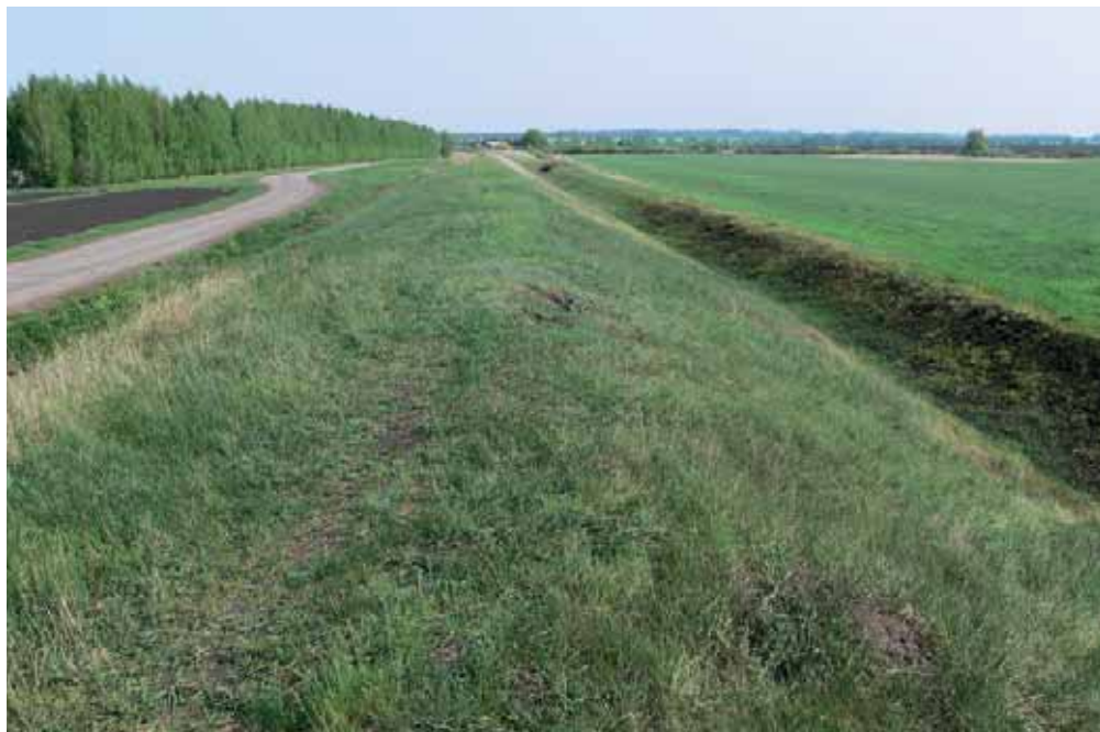
Усманский вал у Девицкого леса

На валу между р. Усмань и р. Боровица изначально находилось 5 стоялых острожков: Красный, Карачунский, Демшинский, Излегощинский и Боровской. Позже были построены: Казачий, Прогорелый, Высокий, Черкасский и Глухой.