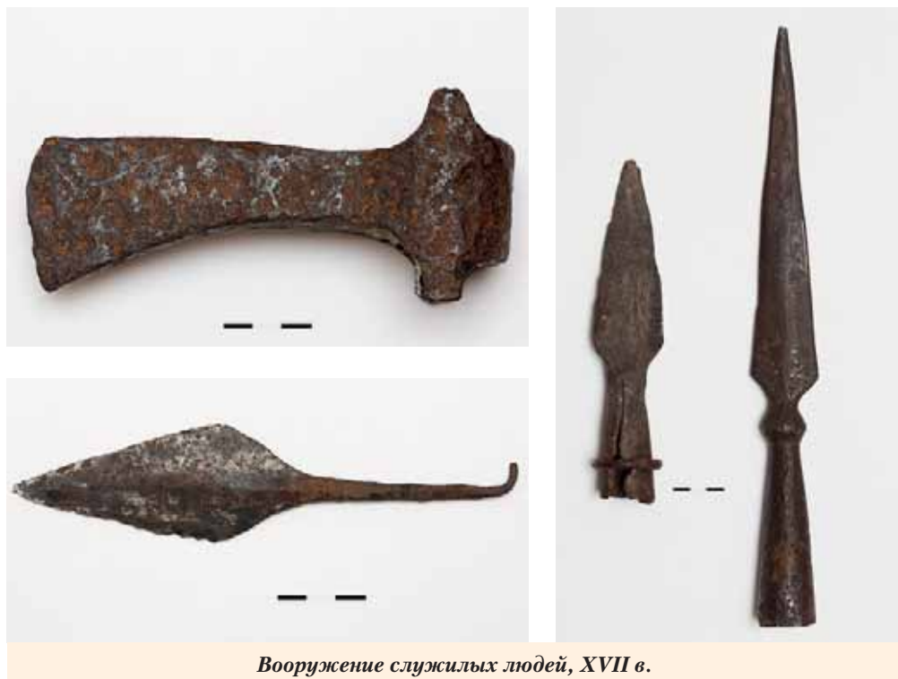
Вооружение служилых людей, XVII в.

девяносто три человека, тридцать дворов бобыльских, людей в них шестьдесят шесть человек».