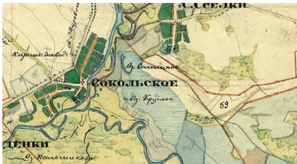
Сокольское на карте Липецкого уезда 1850-х гг.

А.С. Пушкина Алексей Фёдорович Пушкин (?-1777), значительная часть владений которого находилась в Сокольском уезде.