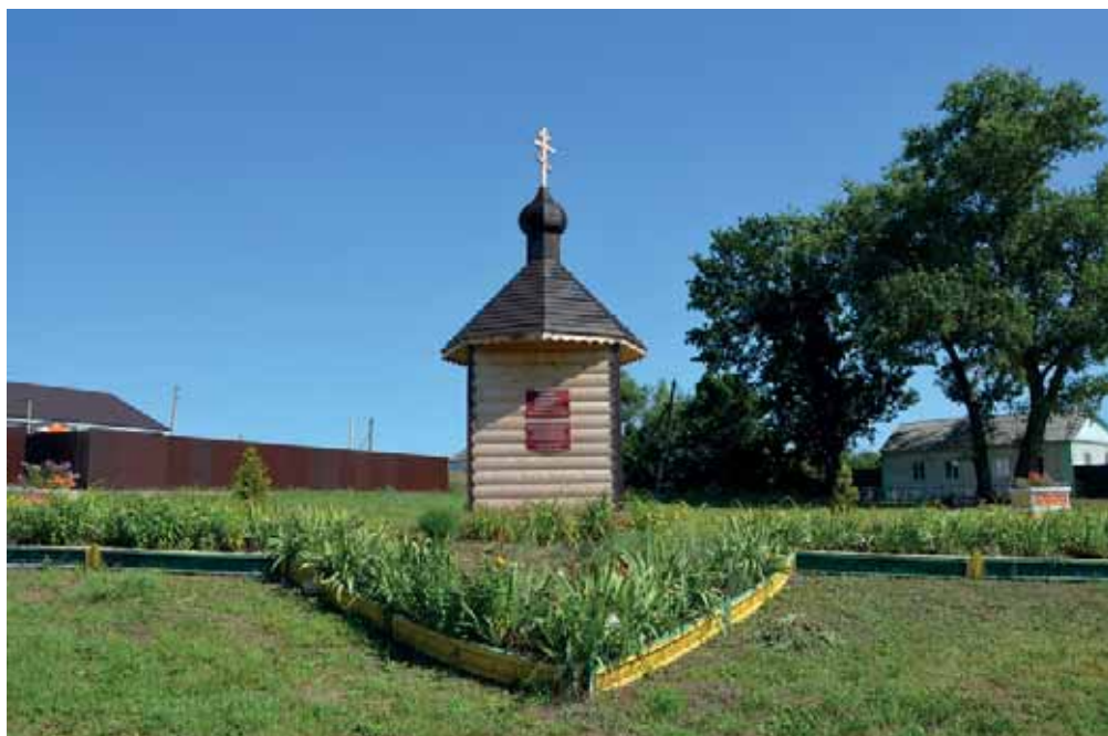
Часовня в память защитников Демшинского острожка

ма, 2 жилых избы для подьячих и колодезь. На башнях 2 пищали на станках, одна длиной 162 см. весом 27 пудов, вторая — 132 см весом 18 пудов. К ним по 100 двухфунтовых ядер. В погребе 17 пудов пороха, 16 пудов свинца, 36 мушкетов, 6 бердышей, полпуда фитиля и 5 киндячных знамён.