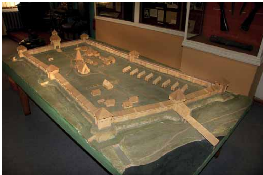
Макет усманской крепости. УКМ

саж., чтобы жители, 100 детей боярских со своими семьями, могли прятаться там «в приход воинских людей».