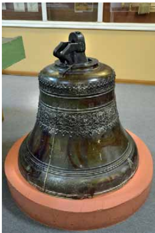
Вестовой колокол с Красной башни. УКМ

В 1681 г. на главную въездную и караульную башню Усмани — Красную, имевшую высоту 19 м., привезён из Москвы вестовой колокол, на котором старинной вязью сделана надпись «190 года октября в 14 день по указу Великого государя дан из розряду на Усмани вестовой весу в нём 14 пуд 37 гривенок» (244,5 кг.). В настоящее время этот колокол хранится в Усманском краеведческом музее.