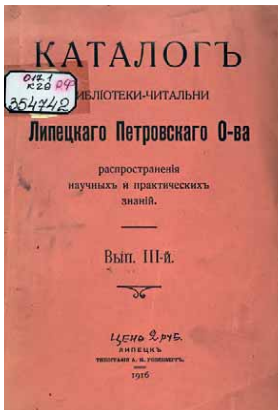
Каталог библиотеки Липецкого Петровского общества, 1916 г.

В 1911 г. в память крестьянской реформы 19 февраля 1861 г. Петровское общество открыло библиотеку-читальню в с. Сокольское, в конце 1912 г. — в с. Романово, а в 1917 г. — на Сокольском заводе.