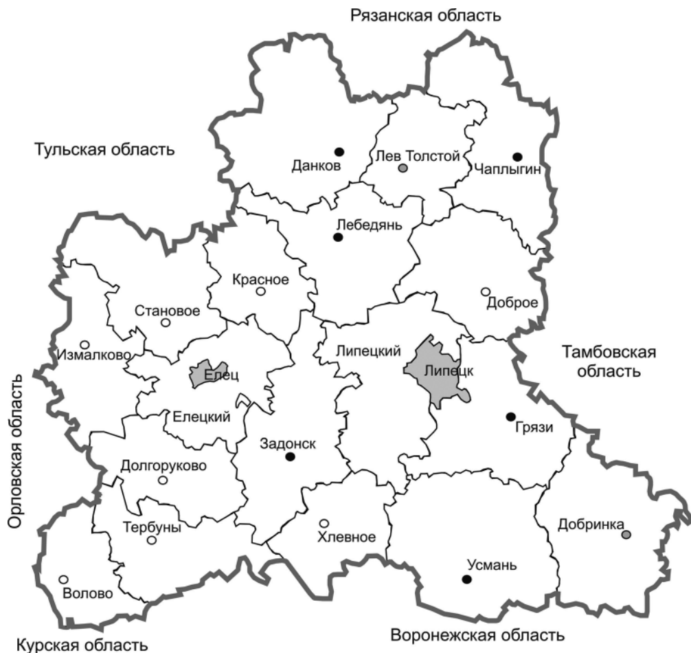
Липецкая область. Современное административное деление. Из книги «География Липецкой области»

Долгоруковский, Елецкий, Задонский, Измалковский, Краснинский, Становлянский, Чернавский и Чибисовский; 10 районов Рязанской области: Берёзовский, Воскресенский, Данковский, Добровский, Колыбельский, Лебединский, Лев-Толстовский, Троекуровский, Трубетчинский и Чаплыгинский; 3 района Курской области: Больше-Полянский, Воловский и Тербунский.