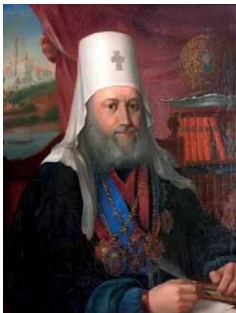
Митрополит Евгений (Болховитинов), 2-я четв. XIX в. ГИМ