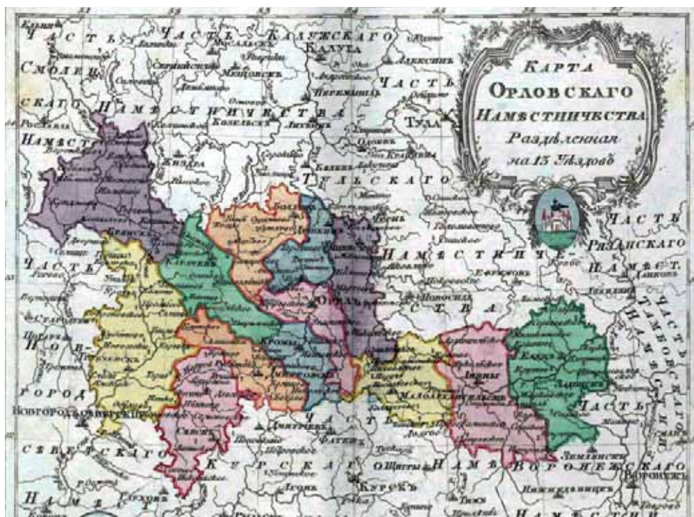
Карта Орловского наместничества, 1796 г.

тус уездных городов в 1802 г. Такое административно-территориальное деление сохранялось вплоть до начала XX столетия.