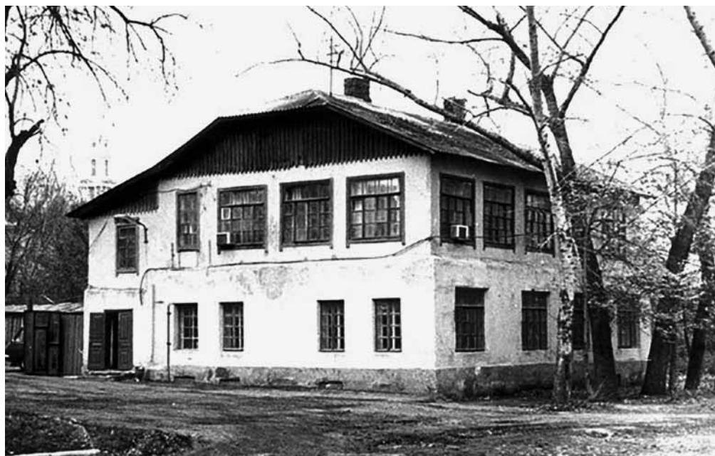
Дом Петровского общества в Липецке. Фото 1970-х гг.

Тамбовский церковно-археологический комитет при духовной семинарии учреждён 11 января 1912 г., о чём сообщил в Св. Синод епископ Тамбовский и Шацкий Кирилл (Смирнов). Тамбовским комитетом была подготовлена «Программа для составления историко-статистического описания церкви», в которой, кроме того, было предусмотрено описание археологических и фортификационных памятников на территории приходов.