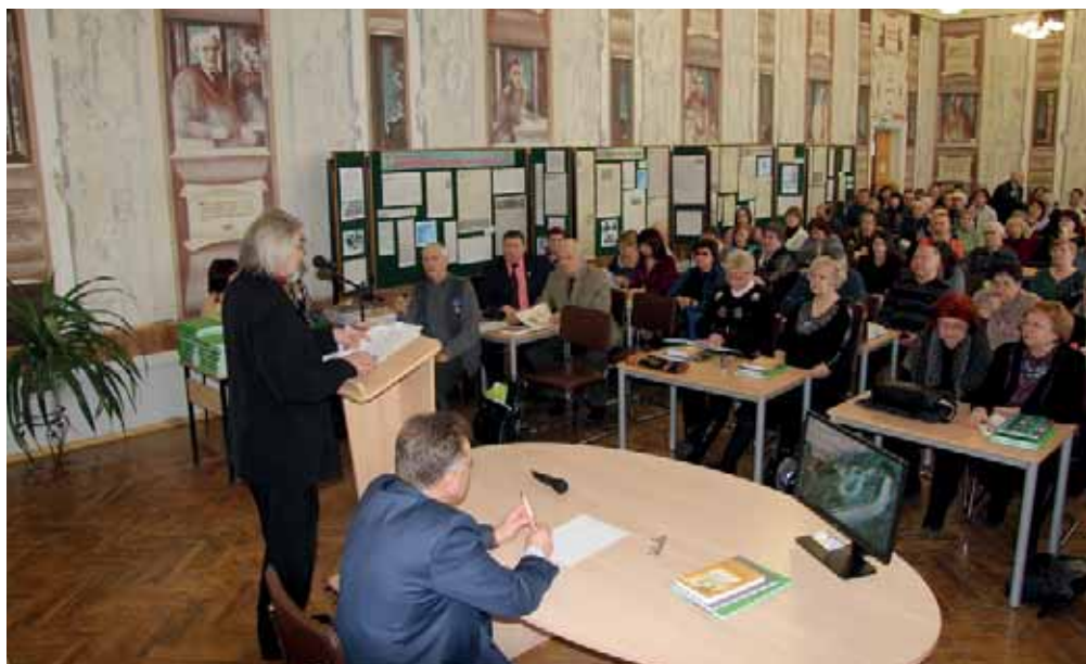
Конференция Липецкого областного краеведческого общества. Фото 2018 г.

В целях популяризации отечественной истории и культуры членами общества разработаны около 50 экскурсионных маршрутов, с которыми за годы работы общества ознакомлены десятки тысяч жителей и гостей Липецкой области. Клуб «Русь» и Липецкое областное краеведческое общество сделали традицией ежегодные поездки в праздник Рождества Пресвятой Богородицы на Поле Куликово.